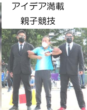
アイデア満載 親子競技