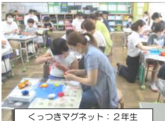
くっつきマグネット：2年生

9月1日に、2年生・3年生で親子ふれあい活動が行われました。どちらの学年とも、親子で楽しく制作活動をしています。