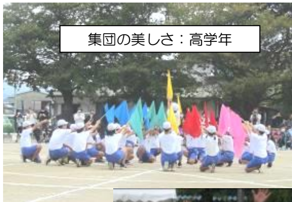
集団の美しさ：高学年