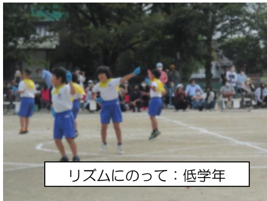
リズムにのって：低学年

低学年は、リズムカルで楽しい体育祭に 中学年は、力強さと元気な体育祭に 高学年は、団結力と、集団での美しい体育祭にしてくれました。