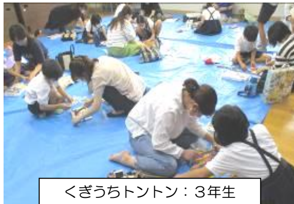
くぎうちトントン：3年生